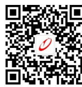
西安理工大学高科学院党委宣传部