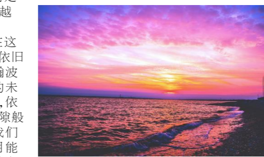
不念过去,不忘将来

世界上最残忍的不是平行线,而是相交线,因为错过了那个交点,就会越来越远。 相识于那个春天的我们,终究在这个冬天选择了结束。相识的沧澜江依旧湛蓝清澈,同游的北海还回响着浩瀚涛涛。我有了新的开始,你也有了你的未来。也许现在回想曾经的相识相知,依然仿佛就在昨日。时光仿佛白驹过隙般流过,眨眼今日间便已形同陌路。我们都曾希望时光能够温养了美好,岁月能够留住了青春,然而生活总是充满着意料之外。